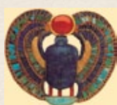
ESCARABAJO Símbolo de vida eterna. El Sol