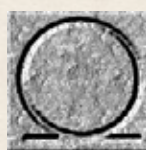
SHEN Símbolo de la eternidad y la reencarnación