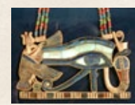
OJO WADJET Protección del bien y del mal