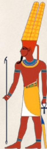
AMON Dios del Imperio