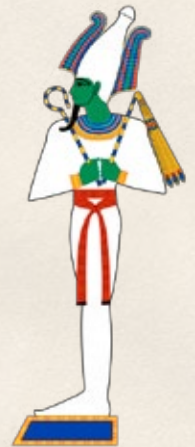
OSIRIS Dios de los Muertos