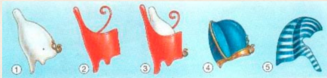
1 Corona Blanca Sur Egipto