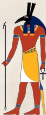
SET Dios del Mal