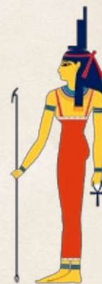
ISIS Diosa de la Fertilidad