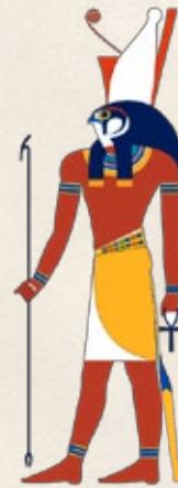
HORUS Dios de la Guerra