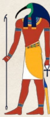
THOT Dios de la Sabiduría