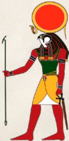
RA Dios del Sol