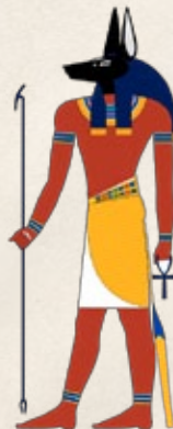
ANUBIS Dios del Infierno